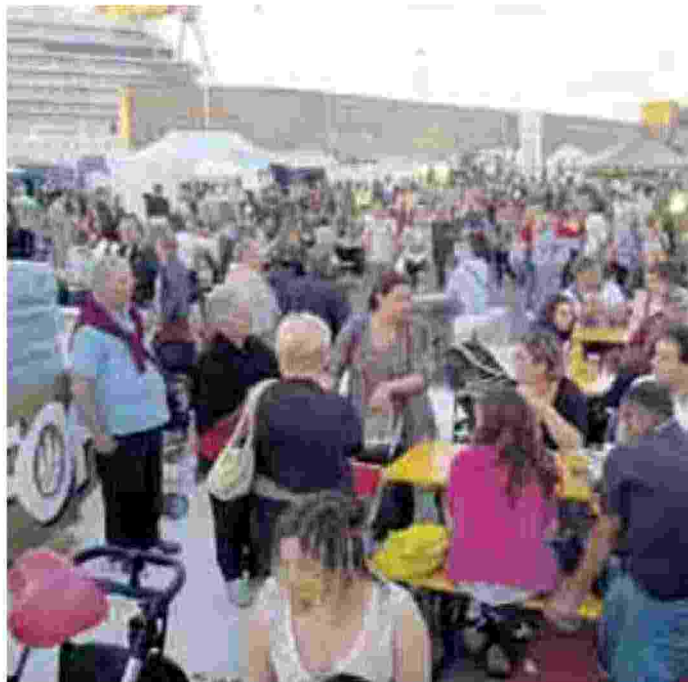
Buona la prima per lo Street Food Festival al Porto Antico inaugurato ieri e aperto anche oggi e domani da mattina a tarda sera. A fianco, lo scalo: la prossima settimana ci sono due feste sui traghetti